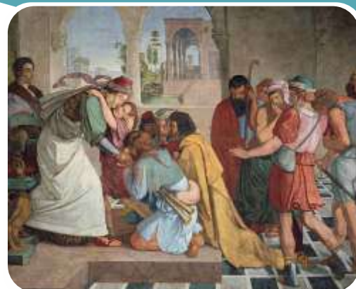
Peter von Cornelius, Iosif se arată în fața fraților săi

Și în Canaan era foamete. Iacob și-a trimis fiii în Egipt să cumpere hrană. Doar pe Beniamin l-a oprit acasă. Frații au ajuns la Iosif, s-au plecat în fața lui, dar nu l-au recunoscut. El i-a recunoscut, a cerut