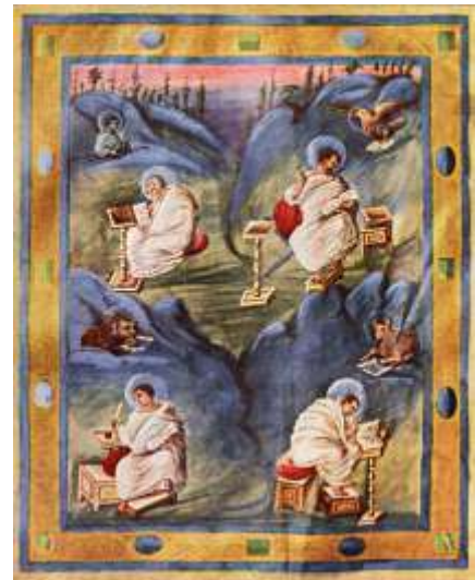
Karolingischer Buchmaler, Cei patru evangheliști