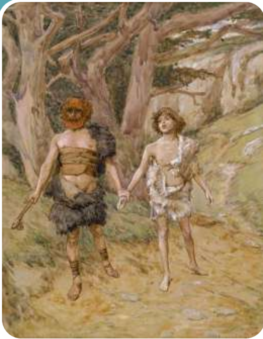
James Tissot, Cain l-a condus pe Abel la moarte

Cain și Abel au fost primii copii ai lui Adam și ai Evei. Abel era păstor, iar Cain lucrător al pământului. După un timp, Cain a adus Domnului ofrandă din roadele pământului. Abel a oferit și el din întâii născuți ai turmei sale. Domnul a privit către Abel și ofranda lui, dar la Cain și la ofranda lui n-a privit. Cain a devenit invidios, s-a mâniat foarte tare și fața lui s-a posomorât. Domnul i-a spus lui Cain: „De ce te-ai mâniat și ai fața posomorâtă? Dacă faci binele, nu-i așa că poți ține [fruntea] sus? Dar dacă nu faci binele, păcatul stă cuibărit la ușă. El caută să fie peste tine, dar tu trebuie să-l stăpânești.”, însă Cain nu a ascultat de Dumnezeu. Cain a vorbit cu Abel, fratele său. Când erau la câmp, Cain s-a ridicat împotriva lui Abel, fratele său, și l-a ucis.