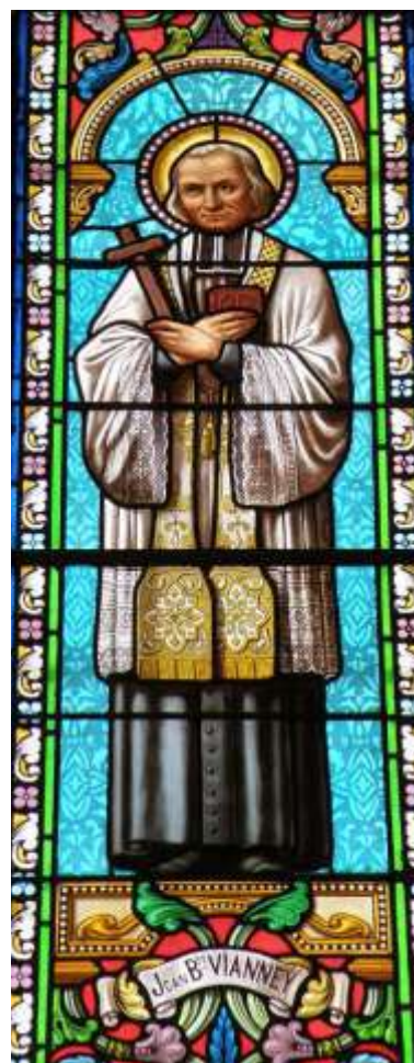
Sfântul Ioan Maria Vianney

Ioan Maria Vianney a fost chemat la Domnul în ziua de 4 august 1859, când avea 73 de ani. El continuă să vorbească despre iubirea milostivă a lui Dumnezeu prin scrierile sale, care s-au răspândit foarte mult. Sfântul Papă Pius al X-lea l-a proclamat fericit , în anul 1905, iar Papa Pius al XI-lea l-a canonizat în anul 1925 și l-a declarat patron al parohilor.