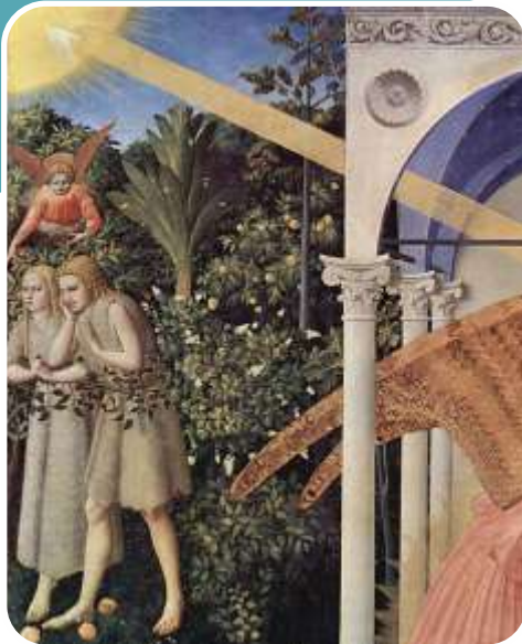
Fra Angelico, Adam și Eva sunt alungați din Paradis (detaliu)