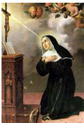
Sf. Rita de Cascia, Mănăstirea Santa Rita, Italia

Invidia l-a împins pe Cain la crimă. Dumnezeu dăruiește fiecărui fiu al său calități și bunuri diferite pentru a fi de folos altora. Trebuie să ne bucurăm și să-i mulțumim lui Dumnezeu pentru toate darurile oferite nouă și semenilor noștri. Sunt daruri gratuite, nemeritate. Să le primim și să le folosim spre slava lui Dumnezeu și binele aproapelui.