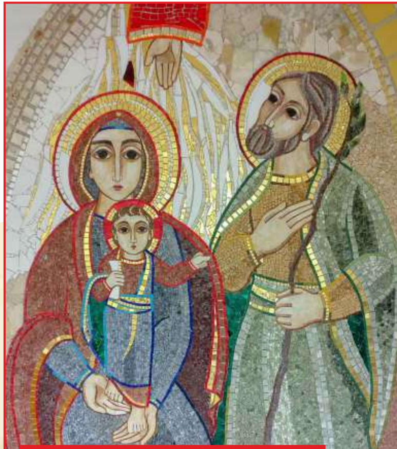
Marko Ivan Rupnik, Sfânta Familie (Branik, Slovenia)