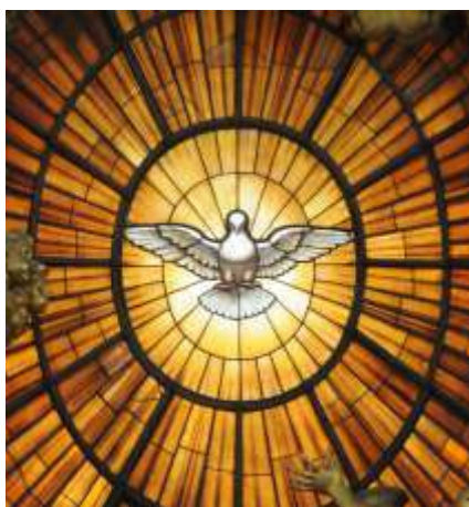
Sfântul Duh, imagine din Basilica Sfântul Petru din Roma